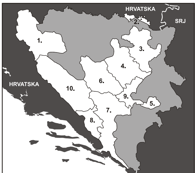
Slika 2: Kantoni u Federaciji BiH

KANTON 10 – Hercegovačkobosanski – zauzima prostor od 5.020 km 2 odnosno 18,8% područja Federacije BiH. Godine 1999. broj stanovnika na teritoriju kantona iznosi 84.153. Taj kanton konstituiraju dijelovi općina ili cijele općine Bosansko Grahovo, Drvar, Glamoč, Kupres, Livno i Tomislavgrad. Udio domicilnog stanovništva, 57,5% iz 1991., ukazuje na velik odljev stanovništva s prostora kantona. Broj stanovnika je 1999. smanjen za 34.104 ili 28,8%, a postotak raseljenih osoba je 19,1%.