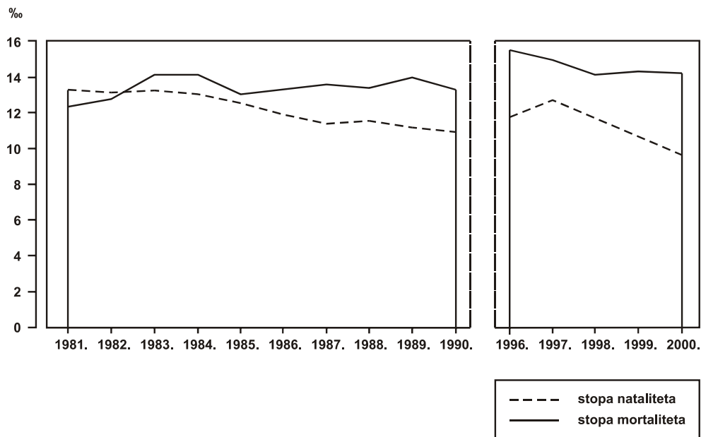
Slika 2: Prirodno kretanje stanovništva Sisačko-moslavačke županije u državi u razdoblju 1981.–1990. i 1996.–2000. 7

Razloge za takve stope nataliteta i mortaliteta valja svakako tražiti u međuovisnosti prirodnoga kretanja i biološke strukture stanovništva, što je sve uzrokovano ponajprije prisilnim migracijama. Tako su se negativne stope prirodnoga kretanja u našem slučaju nažalost još jednom potvrdile kao dobar indikator negativnih promjena i u biološkoj strukturi županijskog stanovništva. Uspoređujući udjele velikih dobnih skupina ukupnog stanovništva Županije 1991. i 2001. (mlado 22,6%, zrelo 52,4% i staro 24,7%) uočavamo porast staroga za 5,9% na štetu zrelog i mladog stanovništva. Ako smo za 1991. rekli da je proces starenja ušao u zrelu fazu, onda nam indeks starenja županijskog stanovništva 2001. ( X_s=1,1 ) govori da je stanovništvo Sisačko-moslavačke županije zašlo u duboku starost, a nažalost neka svjetlija demografska budućnost se ne nazire. (Inače, demografske teorije tumače da je populacija ušla u fazu starenja kada njezin indeks starenja dosegne vrijednost 0,4.)