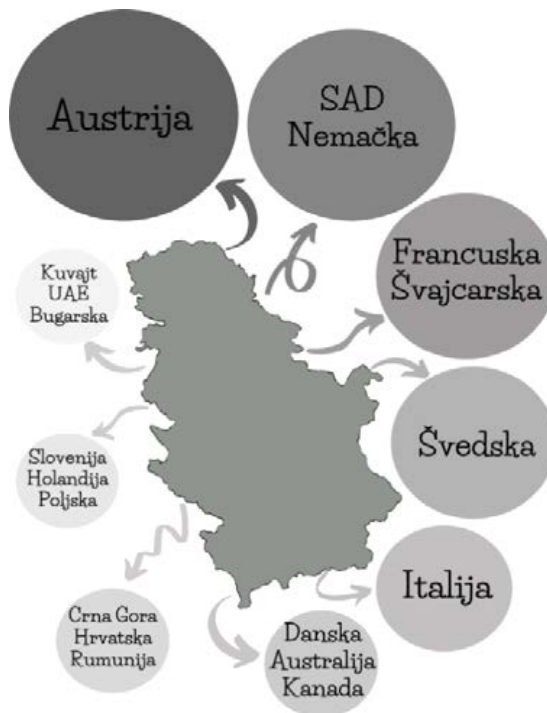
Slika 2. Migrantske mreže učenika srednjih škola Figure 2. Migrant networks of secondary school pupils

S obzirom na to da niko od ispitanika nije imao migraciono iskustvo, stav o tome kakvi su uslovi života u inostranstvu zasnivaju isključivo na osnovu iskustava drugih, odnosno rođaka i prijatelja. Kao najvažniju pozitivnu karakteristiku vezanu za preseljavanje, izdvajaju finansijsku sigurnost, dok su nepoznavanje jezika zemlje destinacije i teškoća u prilagođavanju različitoj kulturi i stilu života neki od negativnih aspekata.